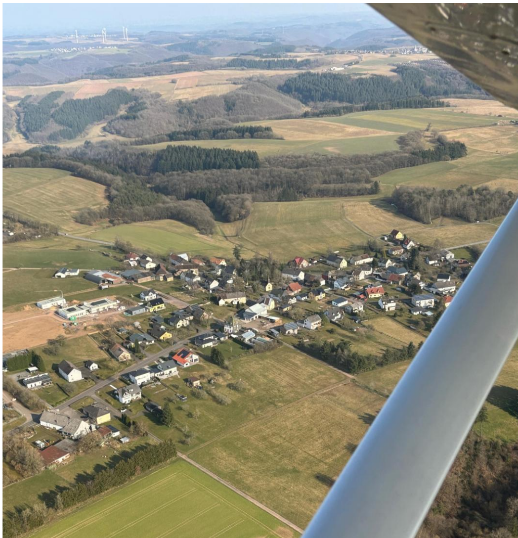
Owaschepe aus der Vogelperspektive

32. Jahrgang · Nr. 10 / 516 Freitag, 18. April 2025